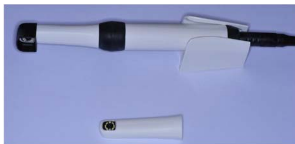
شکل ۱. دستگاه VistaCam iX

باکتری‌ها را برای تابش نور قرمز که انرژی کم‌تری دارد تحریک می‌کند. در مقابل مینای سالم، نور سبز رنگ تابش می‌نماید. این سیگنال‌های نوری با ابزاری اپتیک ثبت و با نرم‌افزار مخصوص DBSWIN پردازش می‌شوند. بر روی نمایشگر رایانه، پوسیدگی‌ها به رنگ‌های مختلف آبی، قرمز، نارنجی و زرد نشان داده می‌شوند و یک مقدار عددی از ۰ تا ۳ به هر تصویر اختصاص داده می‌شود که متناسب با شدت و درجه‌ی پوسیدگی می‌باشد (شکل ۲). ضایعات پوسیدگی، با بالاتر بودن نسبت نور قرمز / سبز آن از مینای سالم تشخیص داده می‌شوند. رنگ‌های آبی ( 1/5-1/0 )، قرمز ( 2/0-1/5 )، نارنجی ( 2/5-2/0 ) و زرد ( 3/0 > 2/5 )، به ترتیب نمایانگر پوسیدگی اولیه، پوسیدگی مینایی عمیق، پوسیدگی عاجی و پوسیدگی عاجی عمیق هستند. در این مطالعه بالاترین عدد نشان داده شده توسط دستگاه در سطح هر نمونه، به عنوان نشانگر محتوای معدنی آن ثبت گردید. نمونه‌ای از تصاویر به دست آمده از دستگاه VistaCam iX در تصویر ۲ نشان داده شده است.